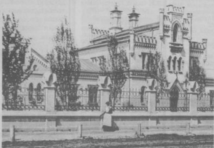
СУМЫ. Дѣтская Больница св. Зинаиды