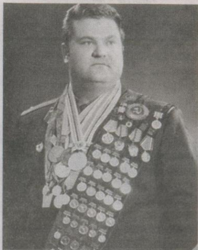
27 кг медалей!

Їх боротьбу на олімпійському помості в Токіо журналісти назвали яскравою сторінкою 18-х Ігор. Тоді наш земляк виграв свою першу золоту нагороду. Було це більше півстоліття тому. Протистояння двох богатирів