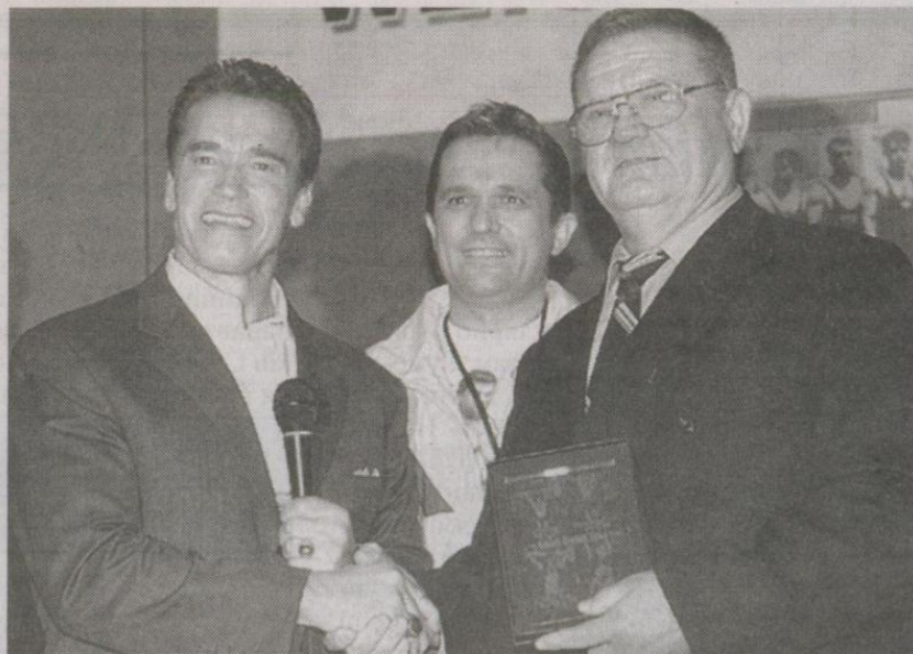
Арнольд Шварценегер і Леонід Жаботинський

тинського. Він встановлює новий рекорд Радянського Союзу, перемагає на розіграві Кубку країни і чемпіонаті Збройних Сил. І це за якихось півроку тренувань після 4-річної перерви. Це був дійсно спортивний подвиг дворазового