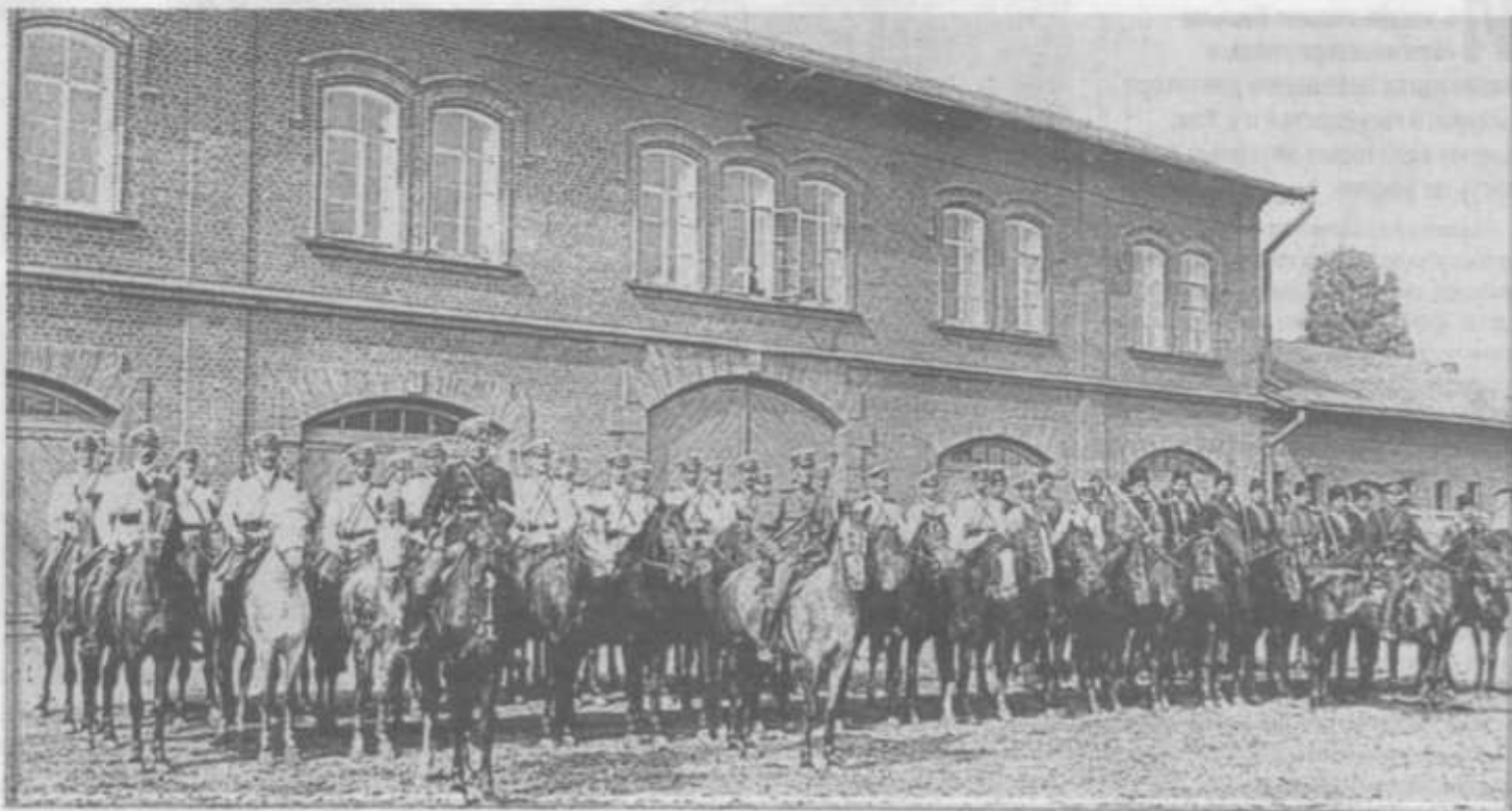
НА ВАРТІ ЗАКОНУ. Сумська поліція біля Павловського заводу