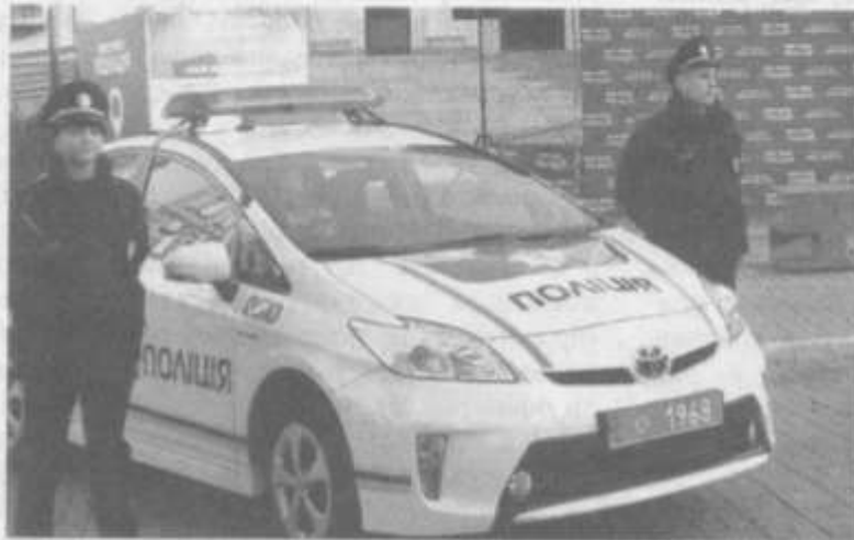
ПАСЕМО ЗАДНІХ. Набір в нову поліцію у Сумах здійснили пізніше всіх

стосувалися життя всього міста. Я тут побачив місто Суми 1805-1862 рр., яке довгий час нам лишалося невідомим. Цікавою виявилася інформація про Малоросійський кірасирський полк, що займав приміщення Сумського гусарського полку. Точний період перебування в місті кірасирського полку встановити не вдалося, але це був довгий період. Йому на зміну прийшов гусарський полк імені Максиміліана Лейхтенберського, а далі тут перебував Білоруський гусарський полк його Імператорської Величності Великого князя Михайла Миколайовича. Далі відомості про військові підрозділи в Сумах відсутні. У 1874 р. з Ізюма до Сум прибув Новгородський драгунський полк. Недовго в місті перебував і Пензенський полк. Я звертаюсь до тих краєзнавців, що полюбляють вишати за свої кошти пам'ятні таблички, щоб вони не забували написати на них і про ці військові підрозділи, щоб історія Сум була повною і всебічною. Загалом, історія перебування цих підрозділів в Сумах як українським, так і російським дослідни-