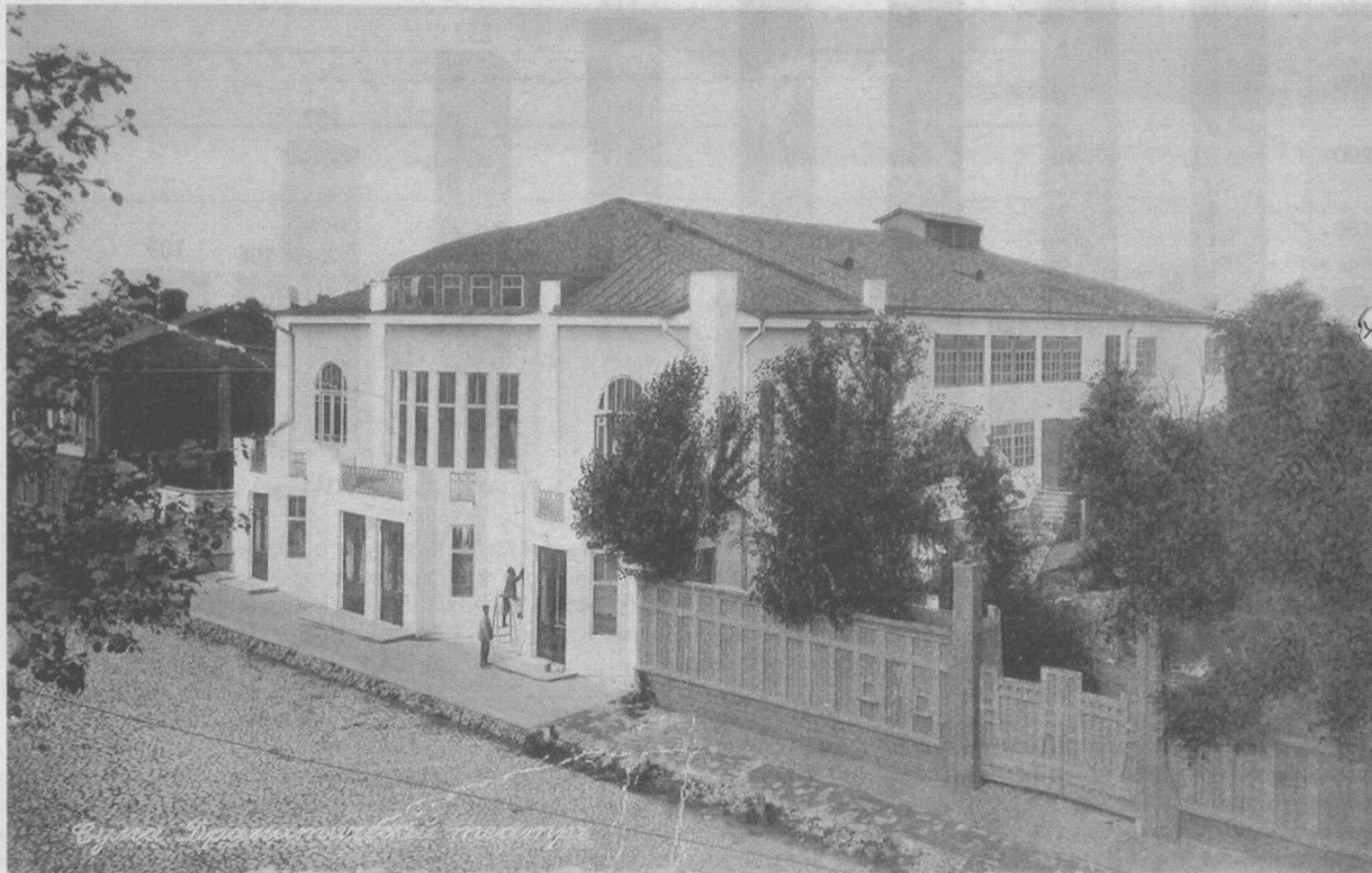
▲ КОРЕПАНОВСКОЕ ЧУДО. Впервые в городе театр обрел свой стационарный дом. Сюда на гастроли приезжали гости, да и сама труппа путешествовала, но иметь свой дом очень важно

До постройки театра «Тиволи» настоящего театра, со своим капитальным зданием, такого, чтобы начинался с рванки, в городе не бы-