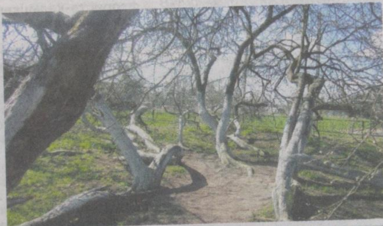
ЧУДО ПРИРОДЫ. Яблоня-колония в Кролевце

У каждого жителя, естественно, приоритеты в путешествиях разные. Кто-то ориентируется на архитектурные особенности, кто-то ищет природную необычность регионов, кто-то просто хочет отдохнуть в сельской усадьбе или половить рыбу в ближайшем пруду. Немаловажную роль для многих играет комфорт и инфраструктура того места, которое собираются они посетить. В этом плане всё очень сложно в нашей области, и за последние годы ситуация не улучшилась, а, наоборот, ухудшилась. Но мы не собираемся сейчас профессионально исследовать рынок местного туризма и рекомендовать пользоваться теми или иными турагентствами. Наша задача – помочь обычной, не избалованной сервисом семье или группе друзей,